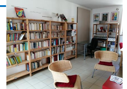
Consultable au siège de la fédération Emprunt ouvert au public