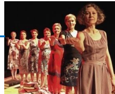
Ouvert aux compagnies amateurs