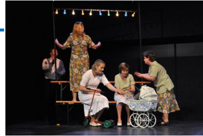
Ouvert à tous les comédiens amateurs